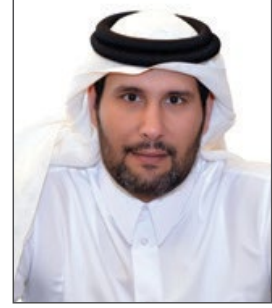
الشيخ / جاسم بن حمد بن جاسم آل ثاني رئيس مجلس الإدارة